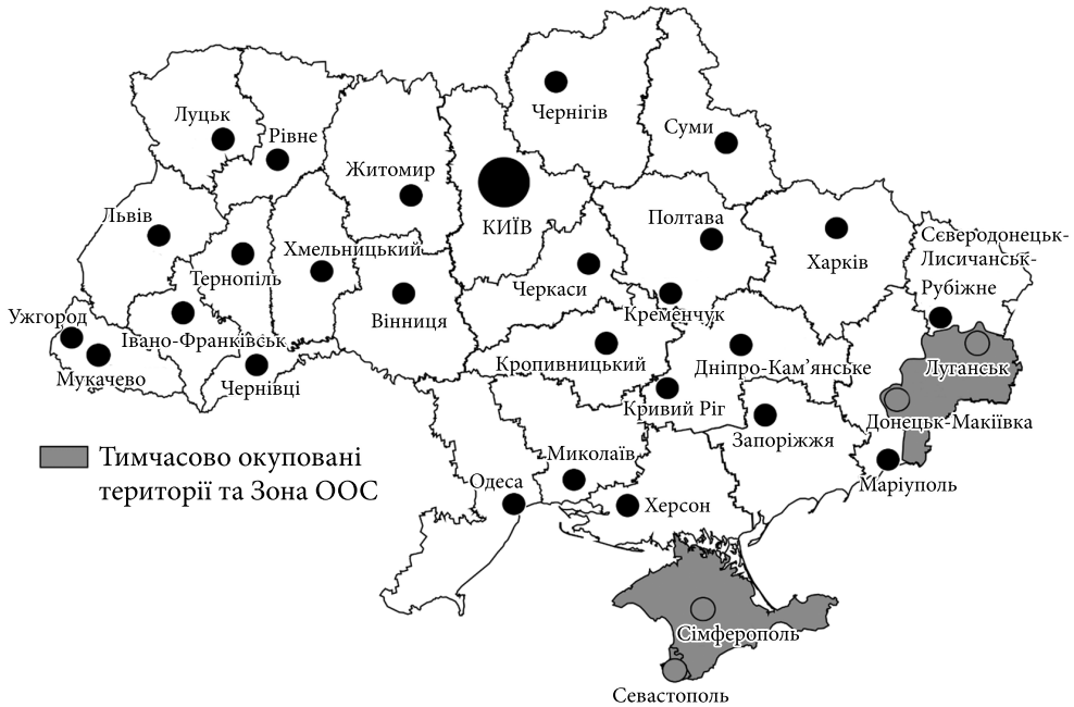
Рис. 1. Регіонополіси у регіонах України

Державної служби статистики України та відкритої бази даних «Pop-Stat» 5 , що сформована на офіційних джерелах даних 6 . Для розрахунку середньорічних темпів приросту / скорочення чисельності населення регіонополісів у різні періоди розвитку України було застосовано таку формулу 7 :