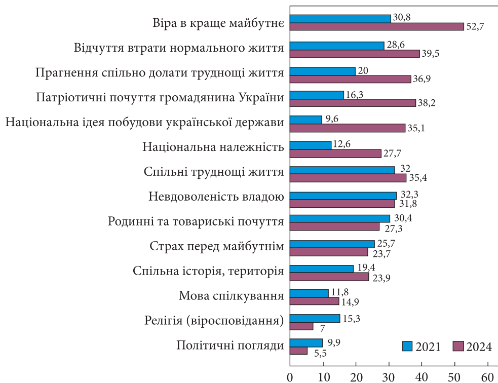
Рис. 1. Трансформація уявлень населення щодо чинників, які об'єднують людей в українському суспільстві