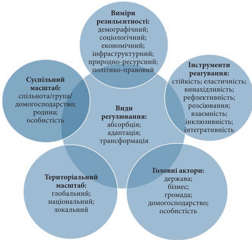
Рис. 1. Схема формування резильєнтності

поступові зміни на постійній основі шляхом пристосування, навчання та інновації. Наприклад, та ж пандемія по-різному вплинула на життєдіяльність різних країн, і переважною мірою різниця пов'язана із якістю політичних рішень, які не спричинили докорінної зміни системи, зокрема державних інституцій.