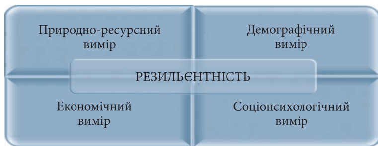
Рис. 2. Основні виміри формування та реалізації резильєнтності

селення — потрібні ресурси. А навіть за отримання масштабної допомоги ресурси України — фінансові, економічні, енергетичні і, головне, людські — знаходяться на межі виснаження.