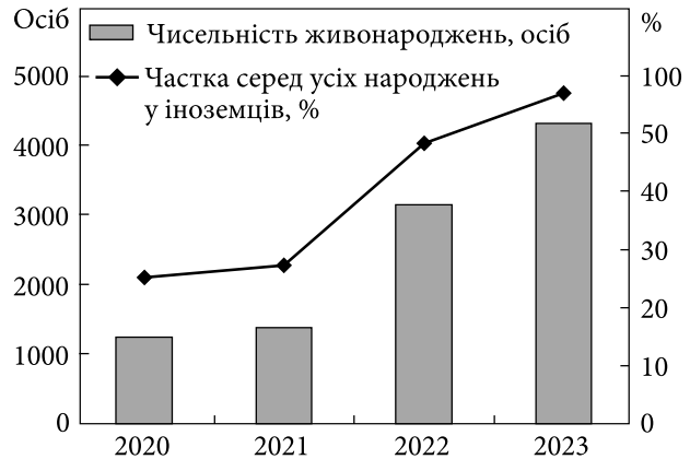
Рис. 3. Чисельність народжених у осіб з українським громадянством та їх частка в загальній чисельності живонароджень у іноземців у Чеській Республіці в 2020—2023 рр.

6 тис., а 18-річних — 7 тис. осіб. Ще один, проте в рази менший, «виступ» на віковій піраміді з боку чоловічої її частини можна спостерігати у віці, трошки старшому за 60 років.