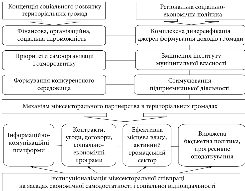
Рис. 4. Механізми розвитку успішного міжсекторального партнерства в територіальних громадах