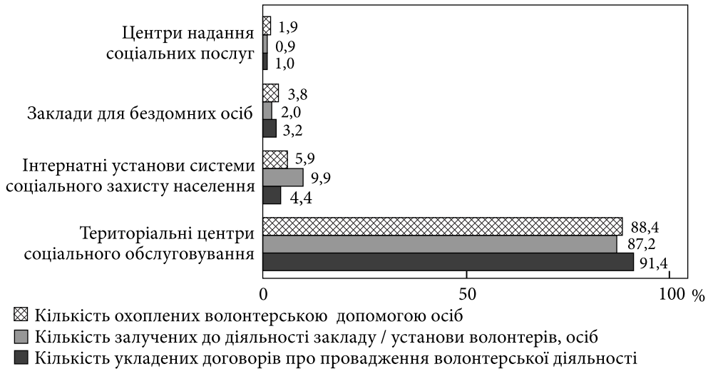
Рис. 3. Залучення безоплатної волонтерської допомоги в закладах / установах системи соціального захисту населення (в рамках укладених договорів)