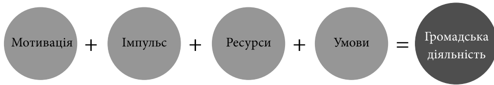
Рис. 1. Інструменти впливу ІГС на процес соціалізації молоді