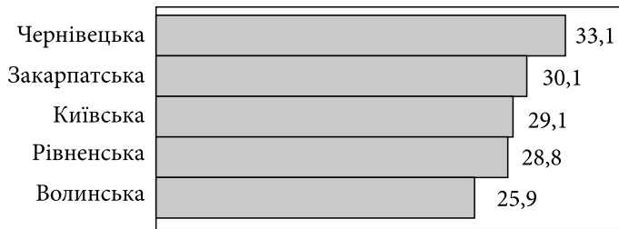
Рис. 3. Зростання витрат (у %) на охорону здоров'я у п'яти областях України упродовж 2000—2020 рр. при зниженні чисельності населення на 20 %

мадян (рис. 1). Наприклад, у Чернівецькій області фінансування збільшилось на 33,1 %, тоді як у Волинській — на 25,9 %.